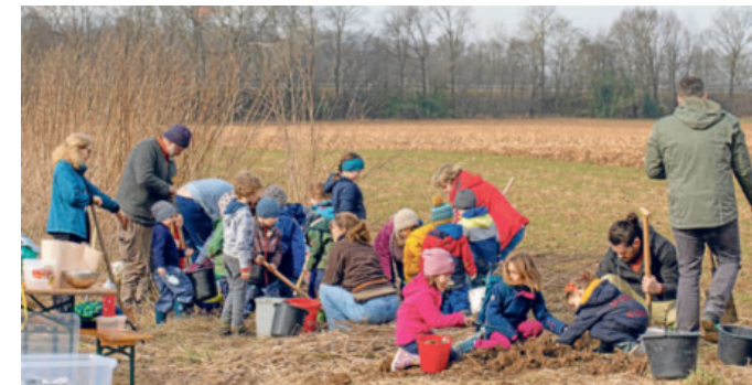
Die Kinder waren mit großem Eifer bei der Sache.

Fein geschnitten mit ein bisschen Salz, oder direkt am Stück wie eine Karotte – in jedem Fall ein Erlebnis wert. Ob mit