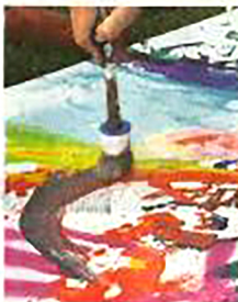
Sicher und letztlich zugleich fähig: Christian Awe am Malplatz.