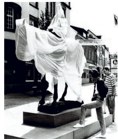
„Little Christo“ hatte schon wenige Tage nach der Einweihung sein Mütchen gekühlt.