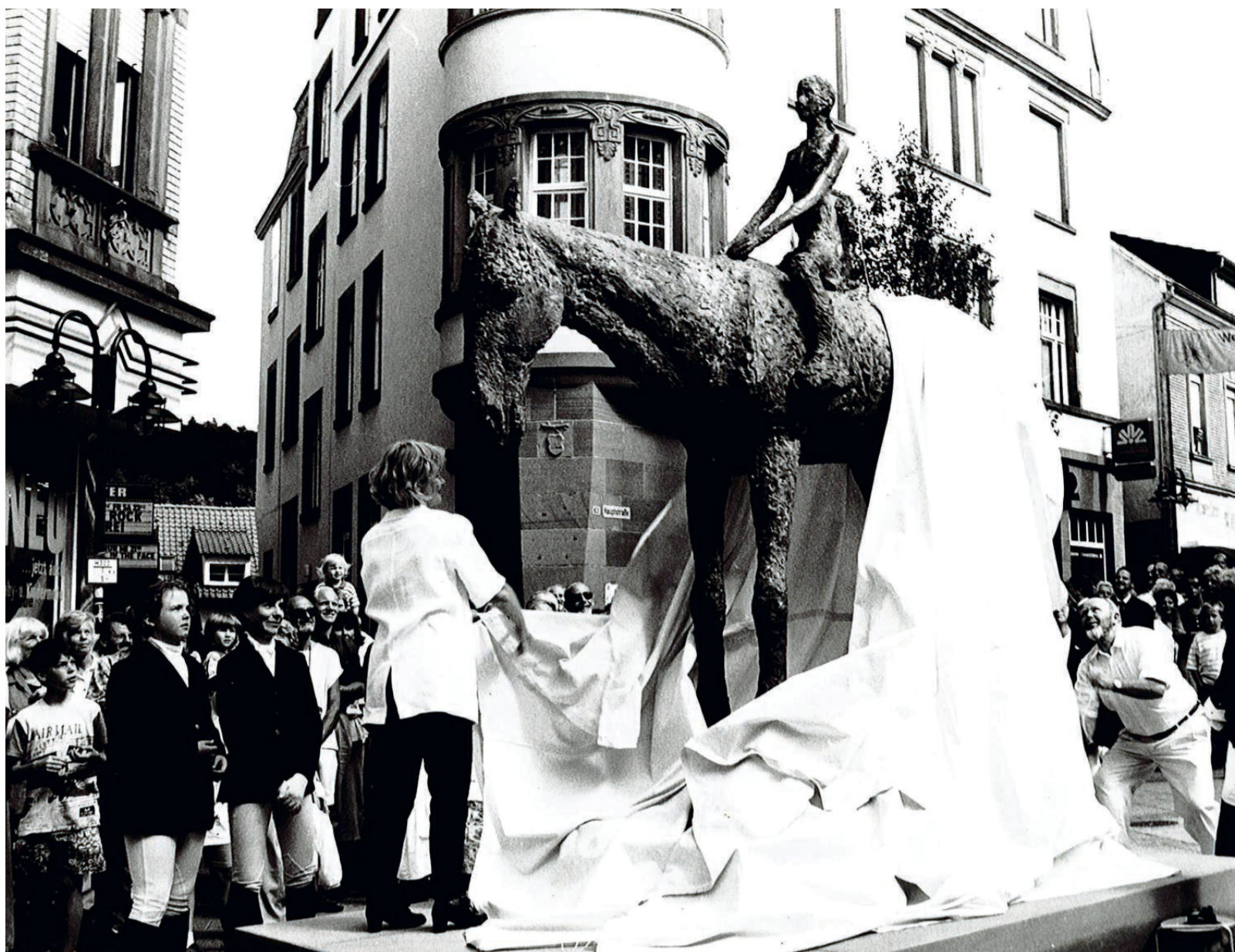
Der große Moment: Vor 20 Jahren, am 20. Juli 1996, wurde die Weinheimer Reiterin feierlich enthüllt. Danach hatte sie bei Teilen der Bevölkerung einen schweren Stand. Längst aber ist sie zu einem Treffpunkt und zu einem festen Begriff geworden.