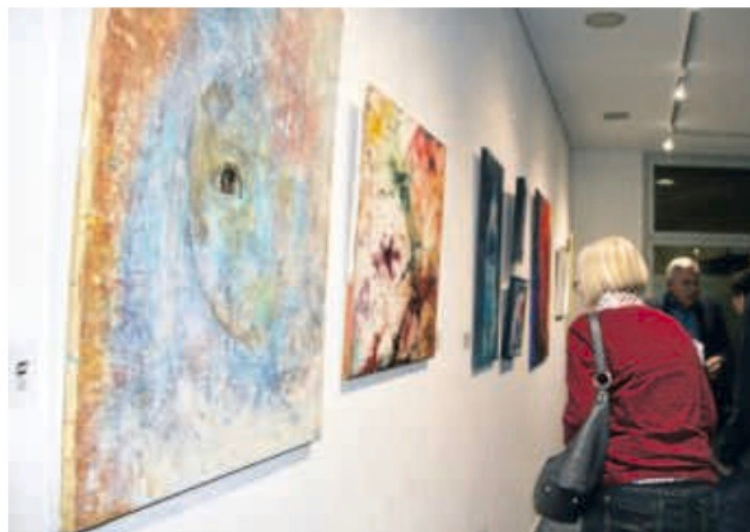
Über 60 Werke von der Acrylmalerei bis hin zu Skulpturen können bewundert werden.